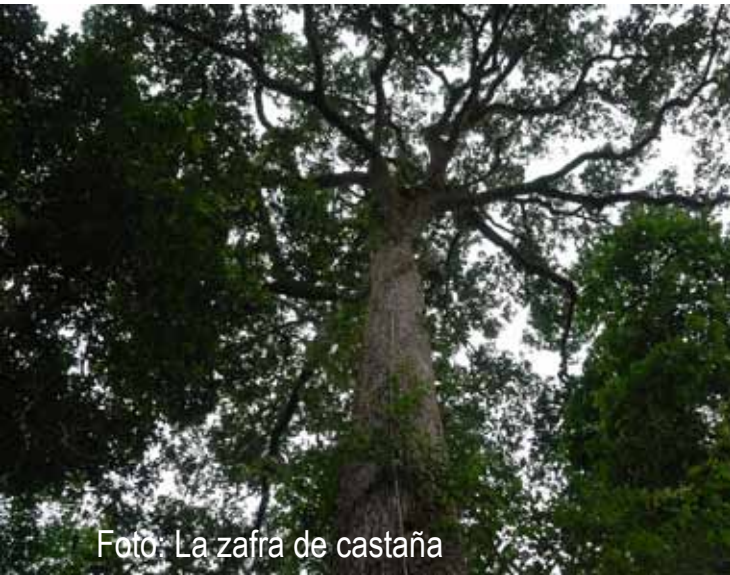
Foto: La zafra de castaña

La experiencia del territorio indígena Tacana II y su organización, en plena Amazonía boliviana es un testimonio fiel de posibilidades para defender su visión de desarrollo ante amenazas del extractivismo. Se trata de una resistencia con diálogo y propuesta, haciendo valer sus derechos, negociando la coexistencia con lógicas de desarrollo distintas.